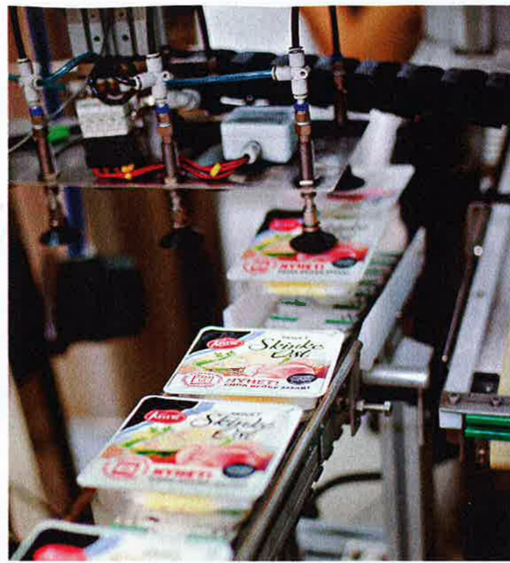
FRA OSTEPØLSE TIL SKIVEOST: Osten henges til tørk som lange pølser før den kan skjæres i skiver og pakkes i plast.

2003-2008, og konklusjonen er at de leverer større overskudd og vekst i inntektene enn andre bedrifter.